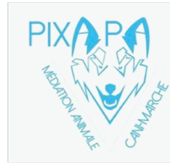
PUYPE Charlotte Fondateur de Pixapa